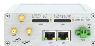
Version de base